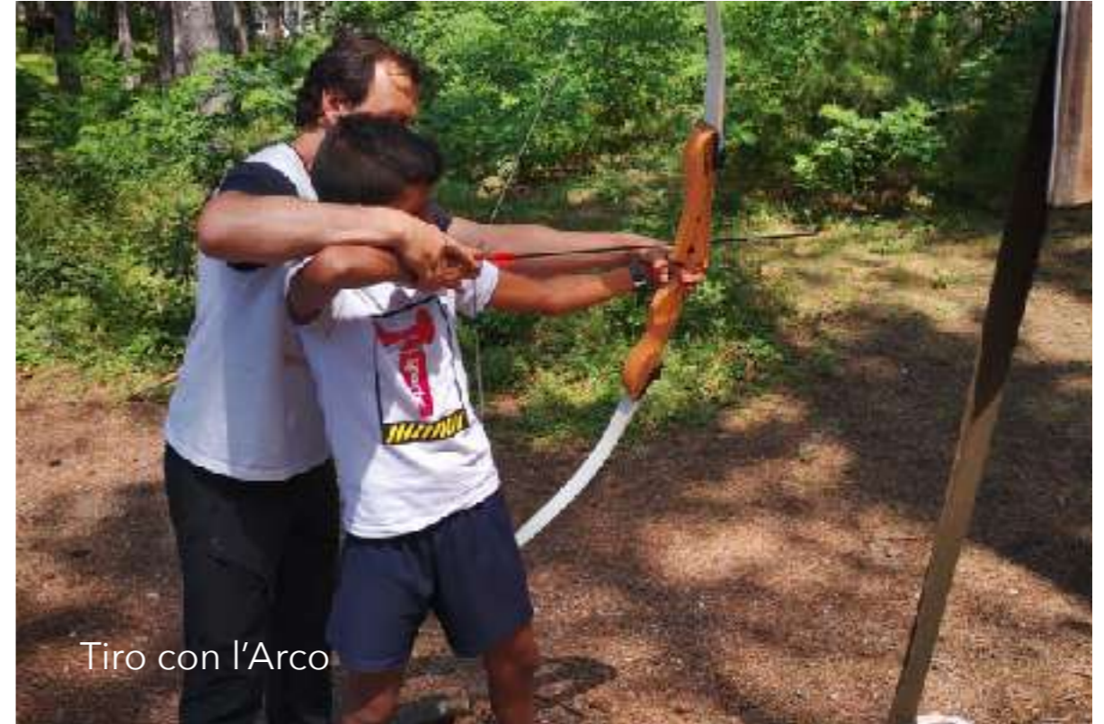
Tiro con l'Arco